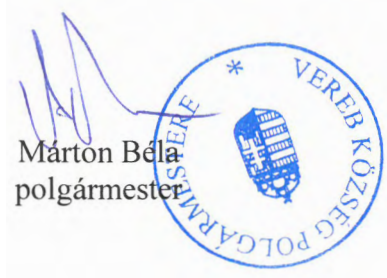
Márton Béla polgármester